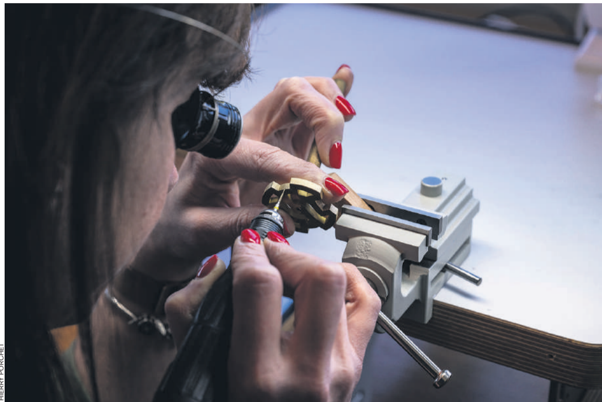
Unia salue l'option d'un contrat type de travail, vue comme une réponse «rapide et nécessaire pour mettre fin aux abus et protéger les salariés», mais pense qu'on peut faire beaucoup mieux.

Le syndicat insiste sur le rôle central du partenariat social pour assurer une concurrence loyale dans l'industrie horlogère jurassienne. Il demande ainsi l'adoption immédiate du contrat-type pour répondre à l'urgence, mais aussi l'ouverture sans délai de la procédure