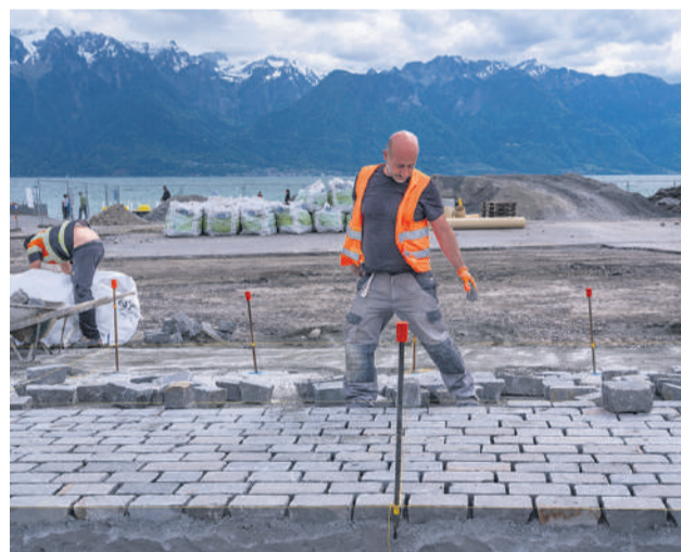
Jouxant le lac Léman, la surface à revêtir s'étend sur plus de 9000 mètres carrés.

sable. A Vevey, l'équipe va employer les deux techniques. Mais pour le tronçon en cours, la première solution est favorisée. «Cette zone est conçue pour les personnes en situation de handicap. Elle doit être parfaitement plate.»