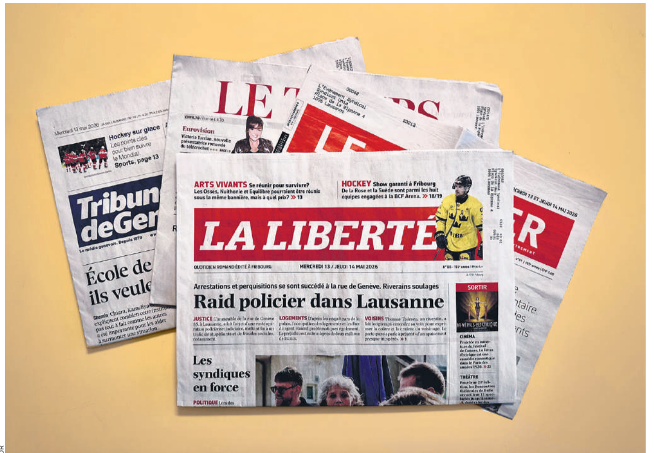
Déjà mis sous pression par une baisse constante des effectifs depuis plusieurs années, les journalistes des titres de St-Paul Médias, éditeur entre autres de La Liberté , doivent au quotidien faire des choix, et renoncer à couvrir certains sujets.

Une série d'entretiens individuels a été lancée, lors desquels certains employés reçoivent un congé-modification, autrement dit un licenciement suivi d'une réembauche à un nouveau poste ou à de nouvelles conditions. «Cela peut par exemple impliquer un changement de lieu de travail, de fonction ou de cahier des charges parfois important, confie