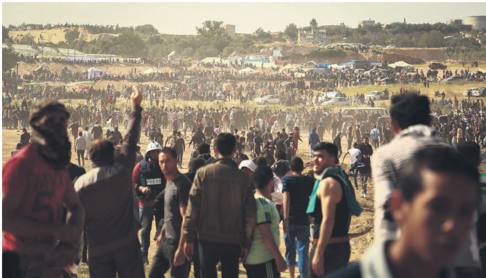
Les pénuries favorisent la propagation de maladies, en premier lieu les infections respiratoires, les maladies de peau et les diarrhées.

PROCHE-ORIENT Médecins sans frontières dénonce la privation d'eau infligée par Israël à la population. Une punition collective qui pourrait encore empirer suite à l'interdiction de nombreuses ONG.