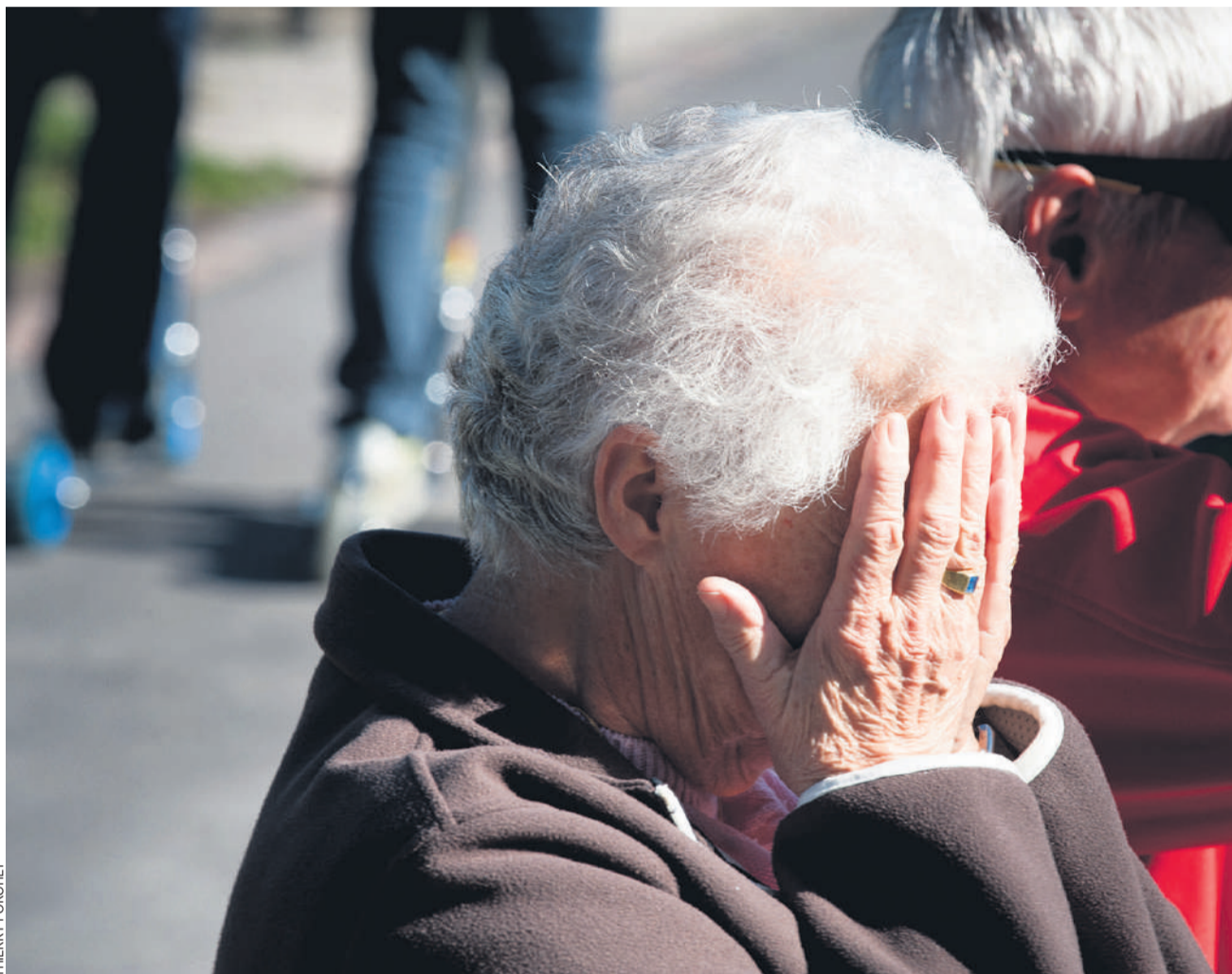
Depuis 2015, le montant moyen des nouvelles rentes versées par les caisses de pension a reculé de 11% pour atteindre un plancher historique. Ainsi, le renchérissement a fait chuter le pouvoir d'achat des rentiers de plus de 7%.

L'USS exige donc que le non ferme à la réforme LPP 21 - refusée par plus de 67% des votants - soit pris au sérieux et que la hausse du coût de la vie soit obligatoirement compensée dans le 2 e pilier, comme c'est le cas pour les rentes AVS. «En rejetant la réforme LPP en 2024, la population a envoyé