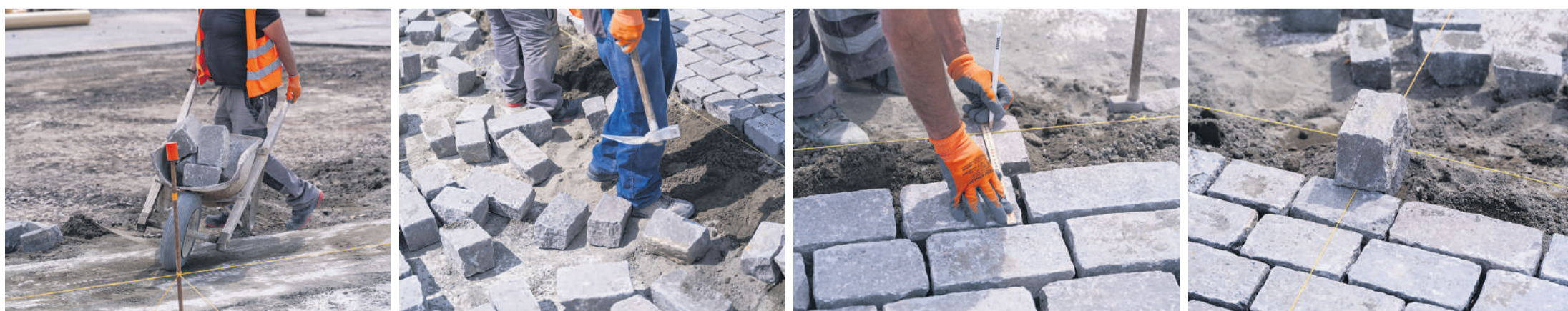
Un travail harassant. L'équipe formée de quatre travailleurs gère chaque jour jusqu'à 10 tonnes de pierres, 4 mètres cubes de mortier et pose en moyenne 15 à 20 mètres carrés de pavés.