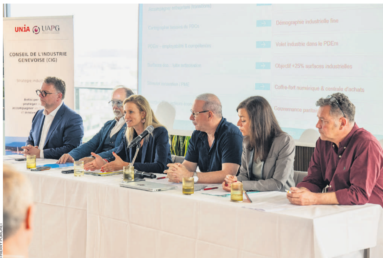
A Genève, le secteur de l'industrie emploie plus de 27000 salariés, représente près de 12% du PIB cantonal et génère 20 milliards de francs à l'exportation vers des pays tiers.

Le CIG insiste: il ne s'agit pas d'une politique industrielle dirigiste, mais d'une stratégie volontaire, élaborée par les partenaires sociaux eux-mêmes, qui converge avec la Stratégie économique cantonale Genève 2035. D'où le soutien de l'Etat, et notamment du Département de l'économie, de l'emploi et de l'énergie. «Plus qu'une association, il s'agit d'un acte de confiance entre les partenaires sociaux et envers les institutions, avec la volonté de