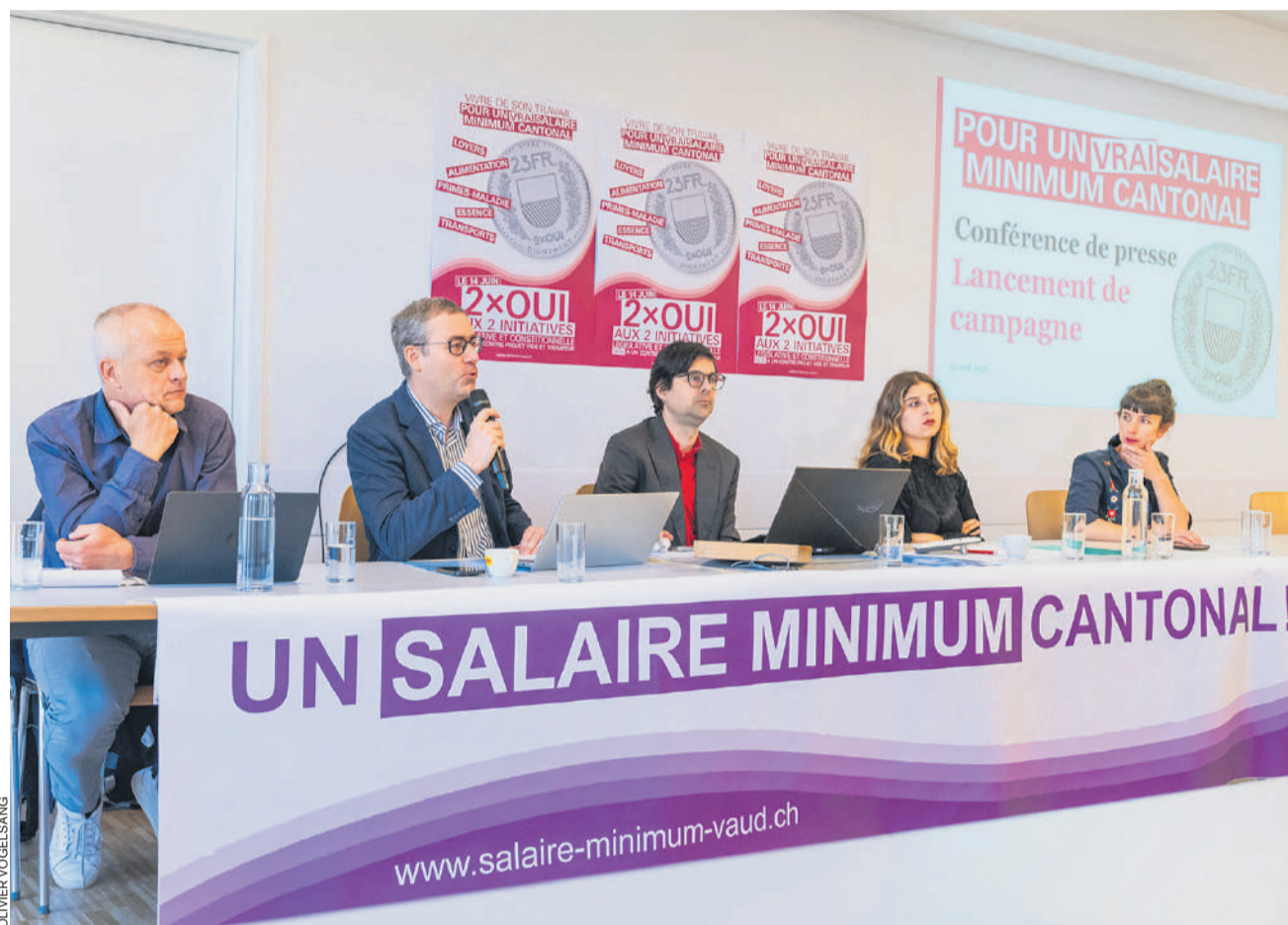
Le comité unitaire annonce que des actions de terrain seront menées dès le 1 er Mai.

Conseiller national et économiste, Samuel Bendahan estime que les en-