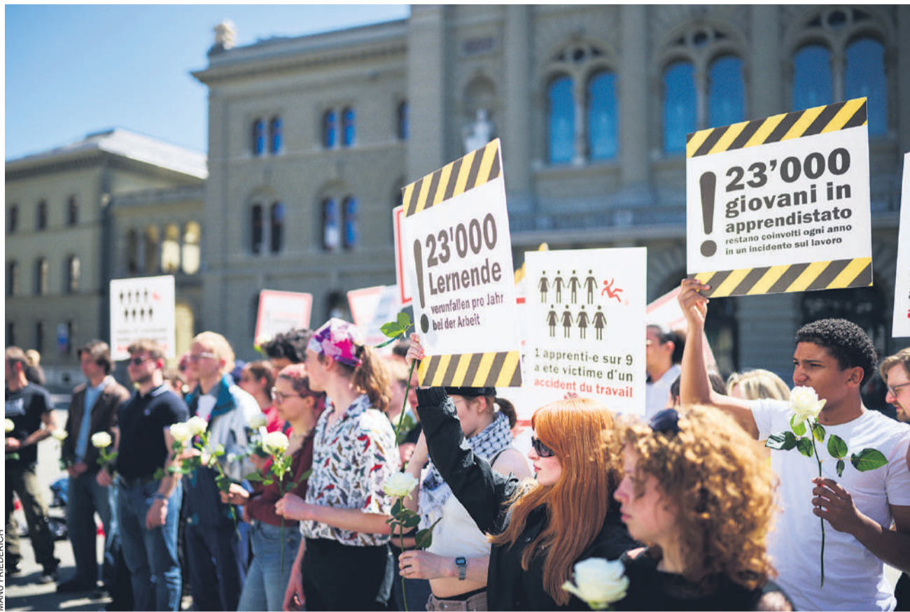
En Suisse, un apprenti sur neuf subit un accident durant sa formation, autrement dit près de 23 000 apprentis sont victimes d'un accident du travail chaque année.