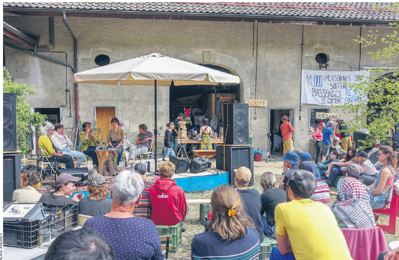
Lors de la 1 ère édition du Festival paysan organisé par la ferme de Bassenges, plusieurs tables rondes ont réuni des femmes paysannes et des agricultrices.

Pour les intervenantes, cette politique privilégie toujours traditionnellement les garçons et met des bâtons dans les roues aux néopaysans. La question des vocations tardives devrait également être prise en compte. Prolonger les délais pour l'aide initiale financière qui s'arrête à 35 ans pourrait être une piste.