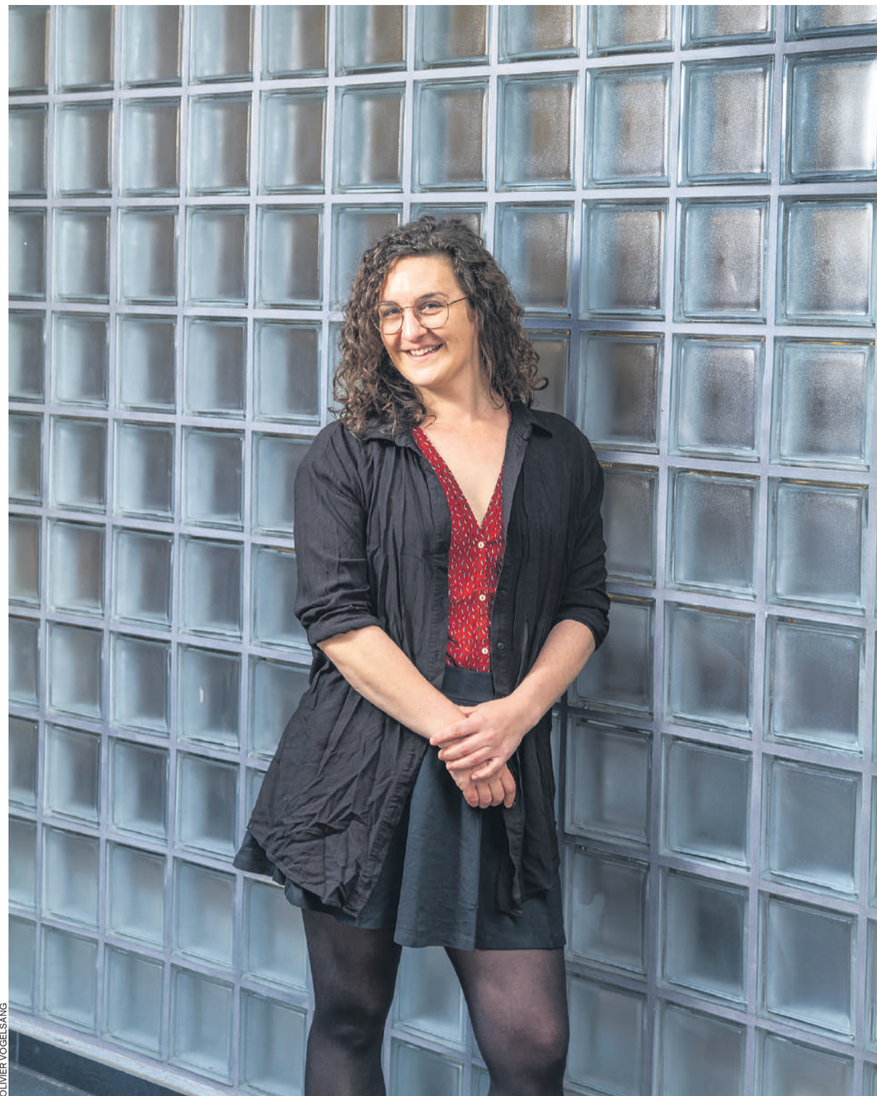
De passage au festival BDFIL, l'artiste est exposée dans le cadre d'un projet avec Médecins sans frontières.

** A voir ici: leandrea.com/a-cases-egales-la-buche-2016