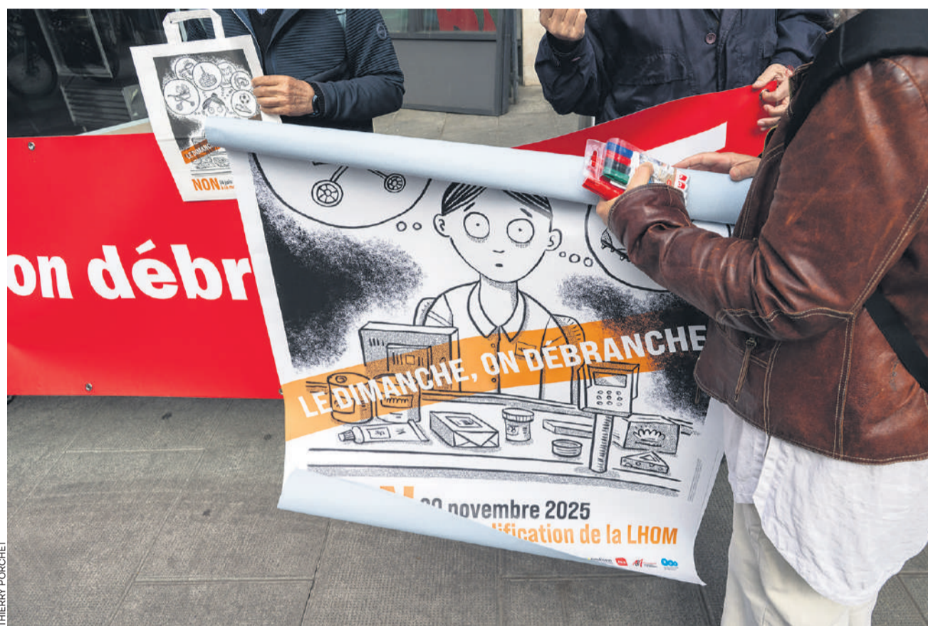
Les représentants du comité référendaire contre la LHOM ont relancé, avec une conférence de presse, la campagne interrompue en 2025.