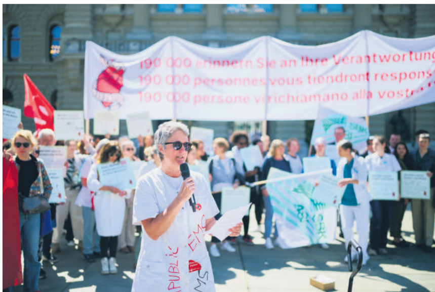
Sur la place Fédérale, le 27 avril, 200 soignantes et soignants ont remis, à la trentaine d'élus ayant répondu à leur invitation, l'appel revendiquant la mise en œuvre immédiate de l'initiative populaire «Pour des soins infirmiers forts».

Le personnel de santé avait déjà voté – lors de la manifestation nationale de novembre dernier à Berne – une résolution prévoyant en dernier recours des mesures de luttes telles que des grèves, si le Parlement devait rester sourd à ses revendications. Pour l'instant, c'est donc vers un bras de fer que l'on se dirige. ■