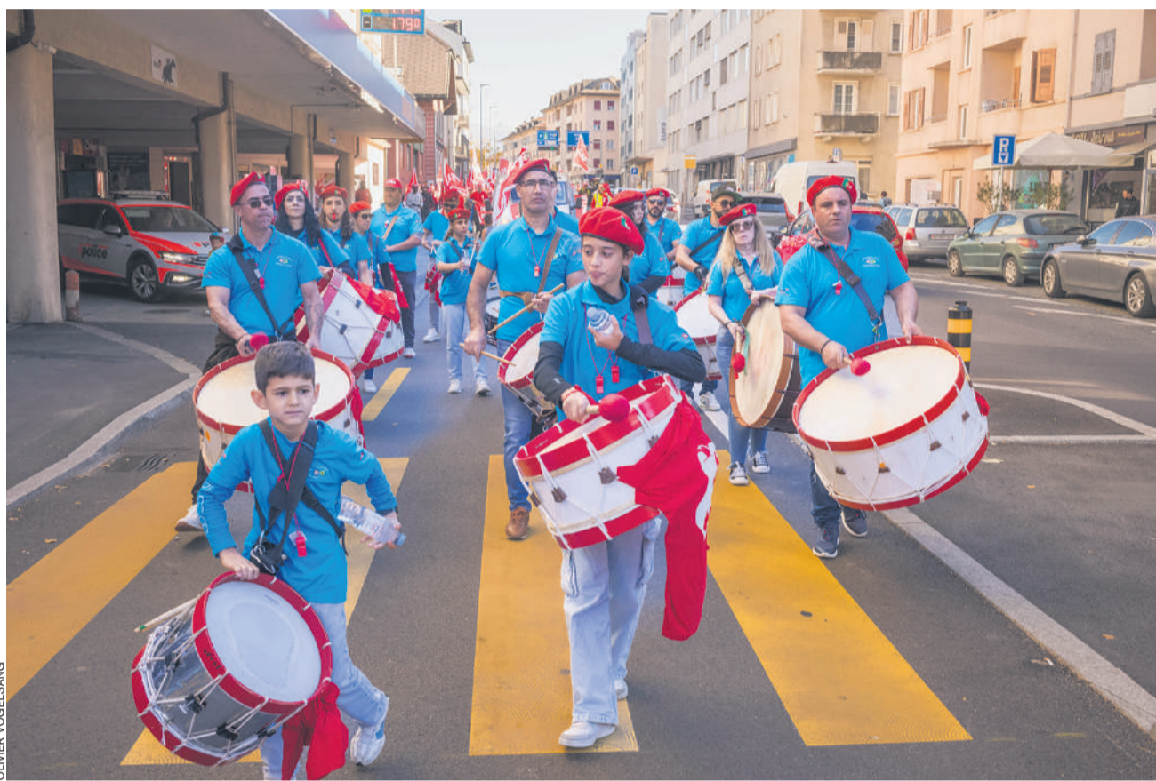
La communauté portugaise de Suisse perpétue ses traditions et sa culture, notamment dans le monde syndical, où elle est très présente. Ici, un groupe de percussions portugaises lors d'une manifestation des syndicats à Sion, en octobre dernier.

Tout dépend comment on définit l'intégration. C'est une communauté qui a tendance à s'auto-organiser. Ainsi, il y a beaucoup d'associations portugaises en Suisse. En 2010, on en comptait plus de 250, actives dans les domaines culturels, folkloriques, récréatifs, sportif ou religieux. Quelques-unes aussi qui défendent les droits des personnes immigrées portugaises, et d'autres qui visent à