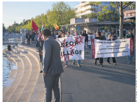
La manifestation à Ouchy le 20 avril.

Après un week-end riche de conférences et de tables rondes – de la souveraineté alimentaire au techno-fascisme en passant par les financements suisses de la police ICE –