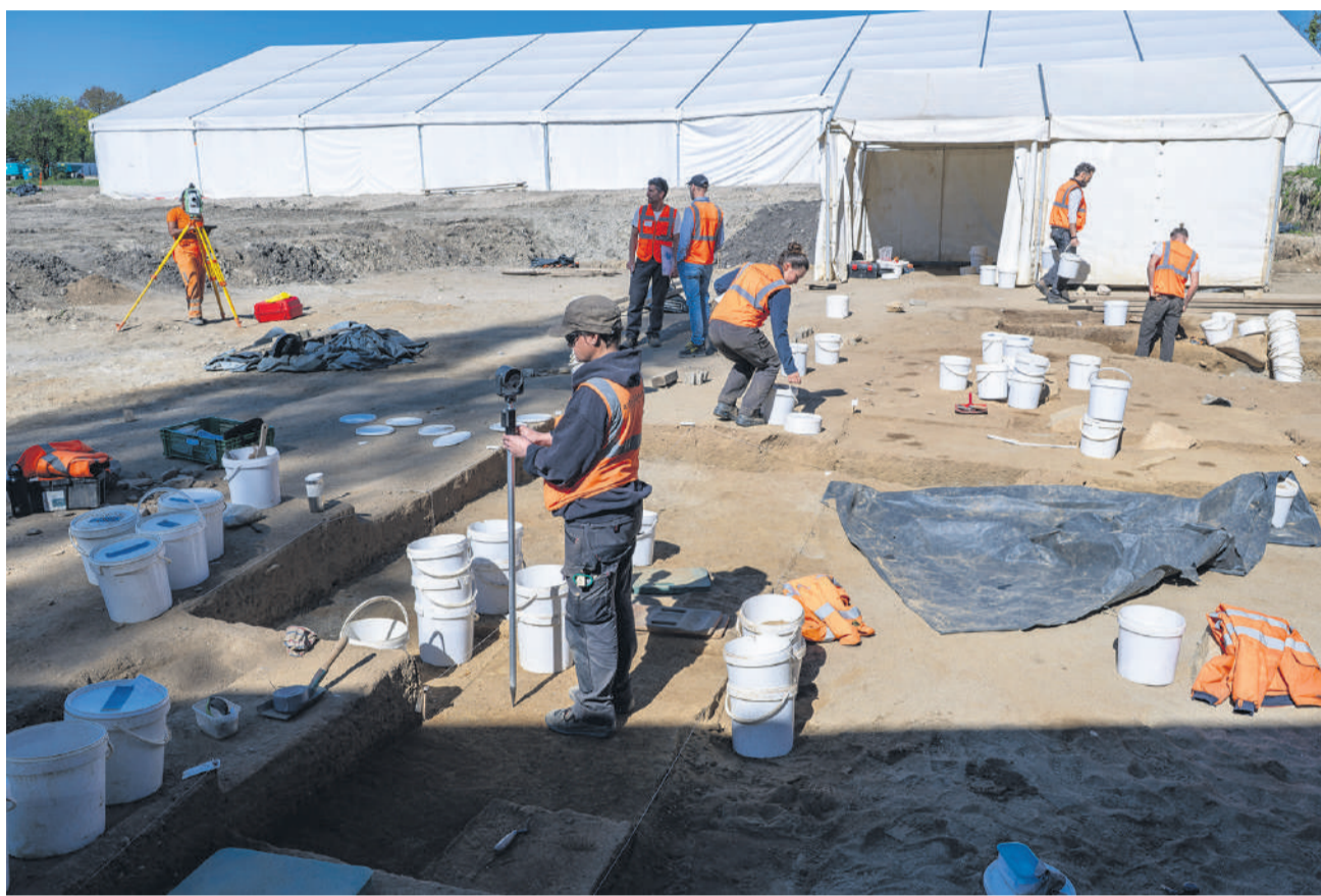
Plus d'une vingtaine d'archéologues sont à l'œuvre quotidiennement sur le terrain de Vidy la Romaine, au sud de Lausanne.

Plus on creuse, plus on remonte dans le temps. Les tachéomètres indiquent l'endroit précis et l'altitude des pièces trouvées au fur et à mesure du décapage par tranche de 5 à 6 centimètres. Les différentes strates permettent d'analyser le mouvement des