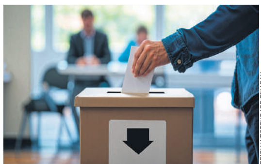
Selon les opposants à la LAFE, les coupes budgétaires auraient un impact direct notamment dans le domaine de l'agriculture durable.

La population du canton de Fribourg fera face à un choix crucial le 26 avril prochain. Dans les isoloirs, elle devra se déterminer sur l'avenir de la Loi sur l'assainissement des finances de l'Etat (LAFE). Celle-ci prévoit de multiples coupes dans le budget, touchant plusieurs domaines allant de l'administration publique aux prestations sociales de toutes sortes. Adopté en 2025 par la