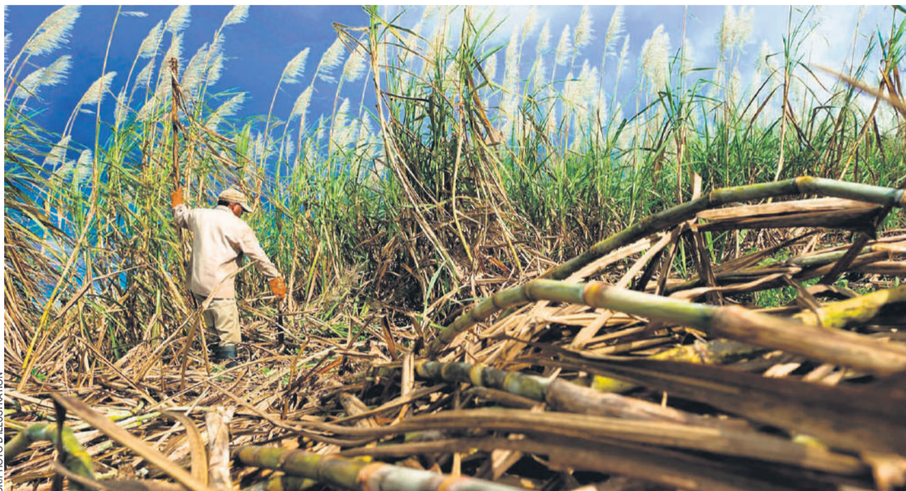
Parmi les domaines les plus touchés par l'esclavage, il y a celui de l'agriculture, dans les plantations de canne à sucre, notamment.

Des secteurs importants de l'économie font recours au travail forcé: les grandes plantations liées à l'agro-business – du café à celle de la canne à sucre, en passant par la viticulture –, le secteur de l'élevage, la production de charbon végétal et la construction civile. De nombreuses employées de maison sont aussi concernées. Les travailleurs migrants représentent une cible de choix, en raison des discriminations qu'ils et elles subissent. C'est le cas des exilés venant de Haïti, du Venezuela ou du Paraguay, mais