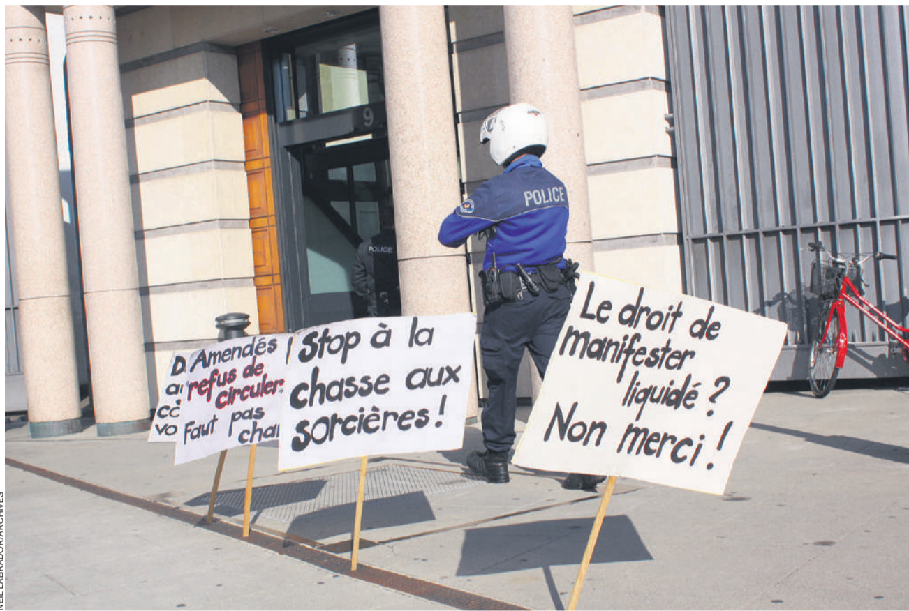
Le rapport d'Amnesty International met en lumière une évolution aussi préoccupante en Suisse, où les libertés d'expression et de réunion se sont nettement dégradées.