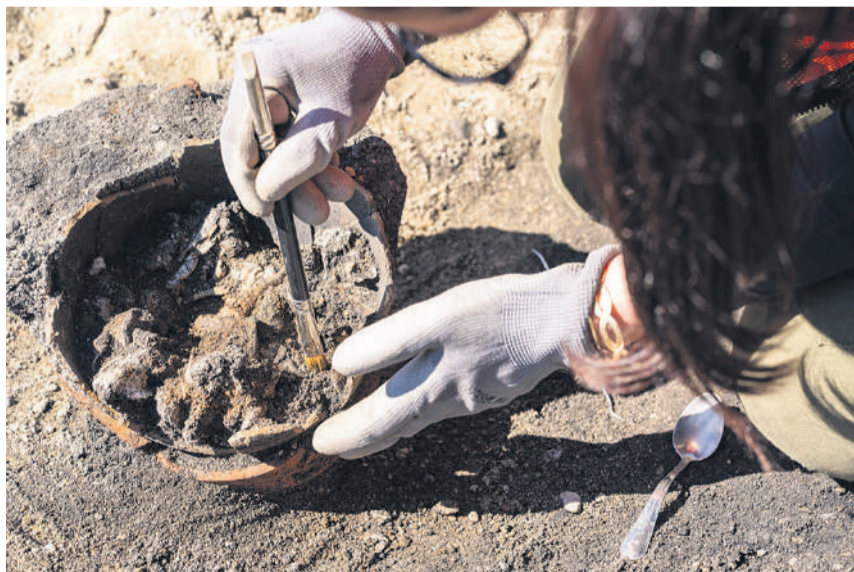
De la pelle-mécanique au pinceau, le travail de fouille demande un large éventail d'outils.