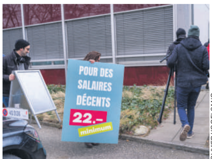
La motion Ettlín constitue une attaque contre les lois adoptées dans certains cantons et villes de Suisse, ou mises à l'agenda politique, comme en Valais ou dans le canton de Vaud.

Le feuilletton que nous sert la motion Ettlín a connu un nouvel épisode le 14 avril. Alors qu'il y a un mois, jour pour jour, le Conseil des Etats se prononçait en faveur de la proposition formulée par Erich Ettlín (Le Centre), la Commission de l'économie du Conseil national lui a emboîté le pas en livrant la même recommandation.