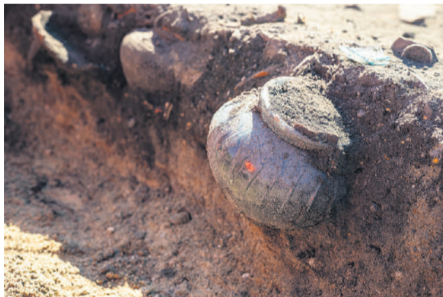
Une des nombreuses urnes en verre.