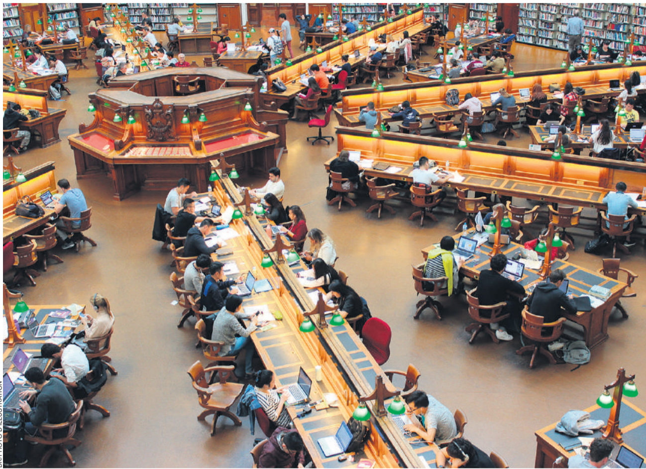
L'adoption de l'initiative estampillée UDC pourrait finir de compromettre la réintégration au programme Erasmus+ des étudiants des universités suisses.