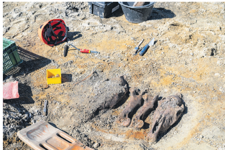
Des os de chevaux dont la mise en scène fait penser à un contexte rituel.

populations dans la région, ainsi que les fluctuations du lac, auparavant plus haut. Les employés d'Archeodunum, l'entreprise mandatée par le Canton, sont quasiment tous archéologues, mais aussi céramologue, archéozoologue, anthropologue, géologue, épigraphiste ou encore lithicien (étude des outils en pierre). Si leur formation est universitaire, leur travail est aussi très physique et manuel. Été comme hiver, à genoux la plupart du temps, ils grattent la terre, l'œil attentif. Les différentes couleurs des strates donnent des indications sur le temps géologique, mais leurs repères concernent aussi l'ouïe et le toucher. Le bruit de leurs truelles contre les différentes couches de sédiments, plus ou moins argileuses, et les structures hétérogènes détectables au toucher les renseignent dans leur quête.