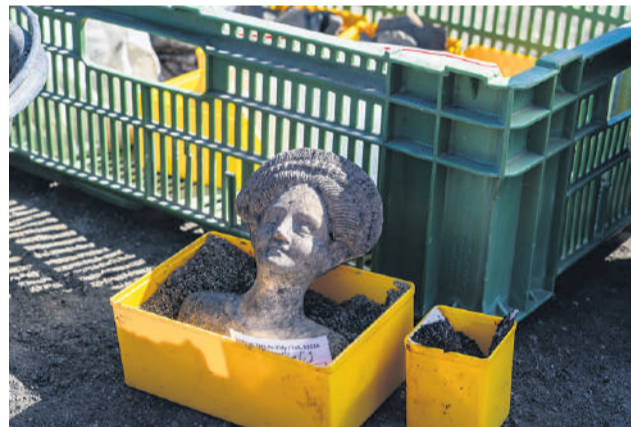
Une statuette, divinité féminine, pour accompagner les morts.