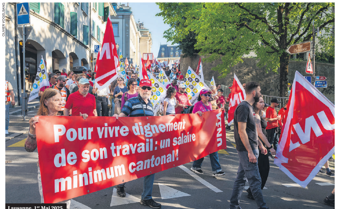
Lausanne, 1 er Mai 2025.