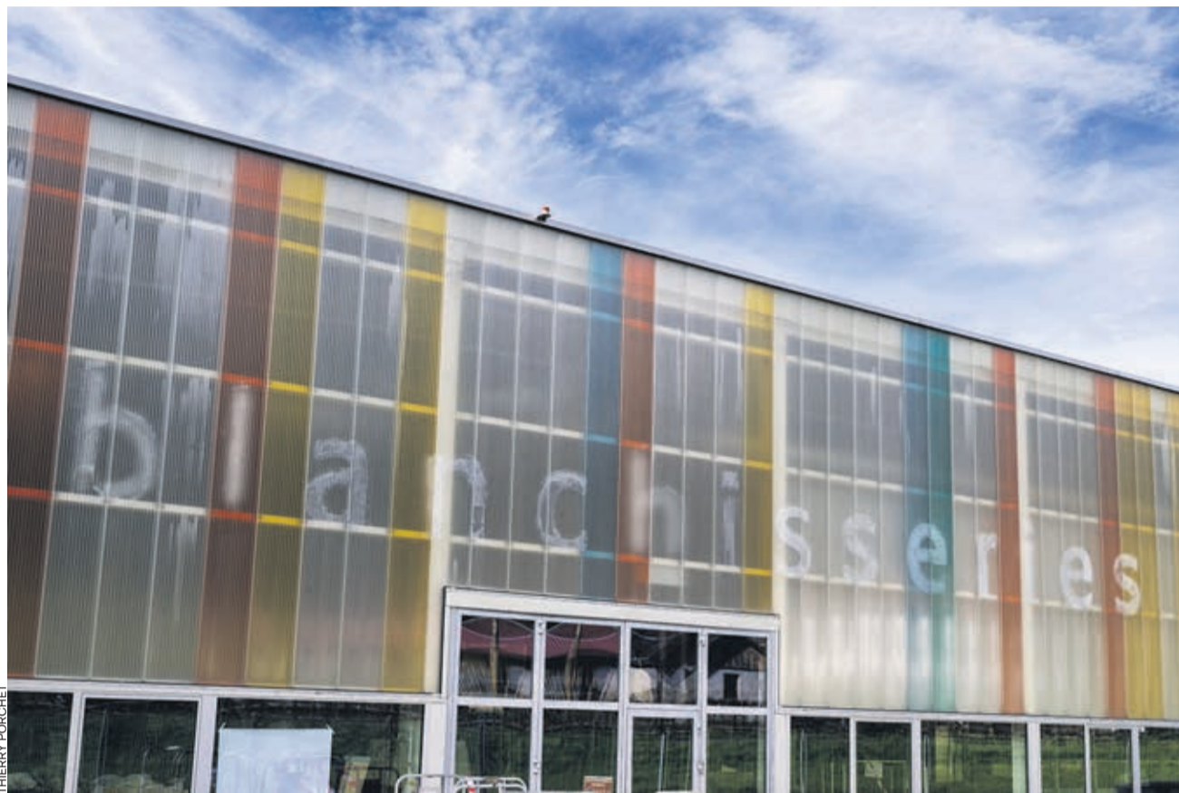
La votation vaudoise sur le salaire minimum risque de venir interférer dans les négociations sur la CCT des blanchisseries, puisque les plus gros employeurs de la branche se trouvent dans le canton de Vaud, comme ici, à Yverdon.

Selon Fiona Donadello, l'association patronale est plutôt ouverte au