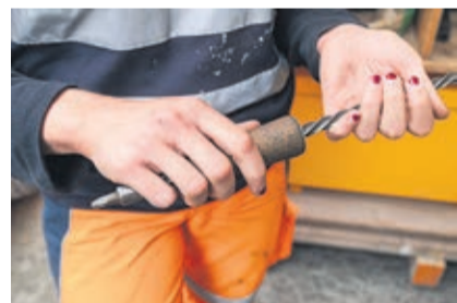
«Pour les filles insérées dans des métiers traditionnellement masculins, les mises à l'épreuve sont très courantes», estime la chercheuse.

On parle de métiers genrés, là où moins de 30% de l'un des deux sexes est présent. Plus les métiers sont masculinisés ou féminisés, plus les normes se rigidifient. Pour les filles insérées dans des métiers traditionnellement masculins, les mises à l'épreuve sont très courantes. Les pionnières succèdent aux pionnières... Autrement dit, la mixité avance à petits pas. Dans les secteurs encore dévolus aux hommes, les femmes sont rarement les bienvenues. Lors d'une enquête, une apprentie de la restauration relatait que ses collègues de cuisine avaient partagé leur étonnement sur sa longévité en regard de tout ce qu'elle avait dû endurer de leur part. Une paysagiste confiait, elle, qu'on lui avait littéralement scié la branche sur laquelle elle était assise. Enfin, je pense aussi à cette mécanicienne auto dont les clients rechignaient à lui laisser leur voiture. C'est aussi révélateur que certains employeurs disent préférer exclure les filles par «bienveillance», car les conditions de travail sont trop dures. Le fait de devoir «fourbir ses armes», «aiguiser son caractère», «supporter la douleur» semble être inhérent à ces secteurs masculinisés aux dires des formateurs et des collègues. Cette rudesse physique et