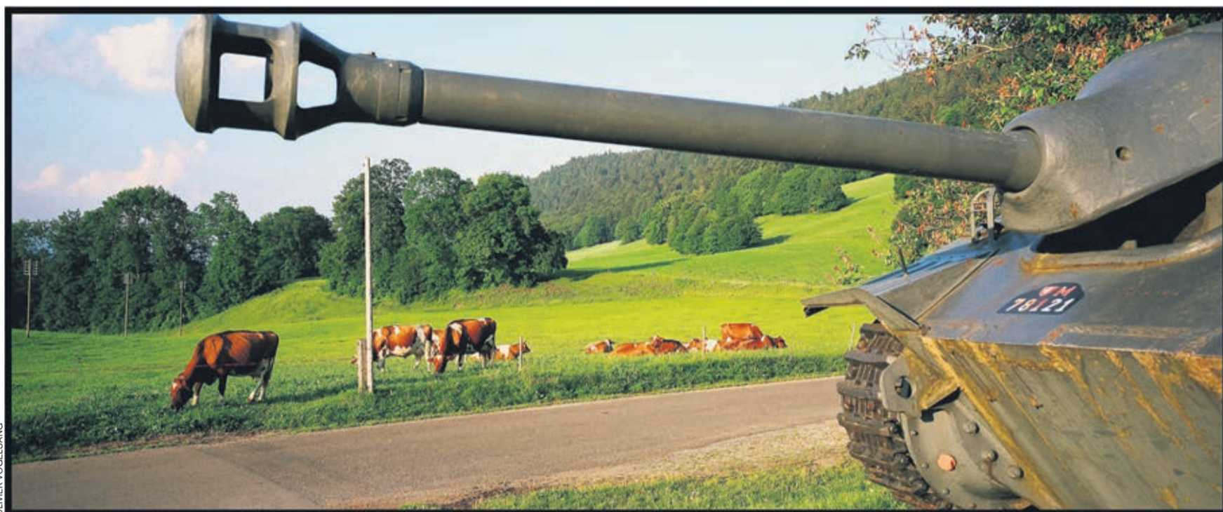
Les entreprises suisses d'armement ont exporté en 2025 pour 948,2 millions de francs de matériel de guerre vers 64 pays, soit de près de 43% de plus par rapport à l'année précédente.

«Il y a plusieurs changements majeurs prévus. La nouvelle mouture entend supprimer la déclaration de non-réexportation. Aujourd'hui, les pays acquéreurs ne peuvent pas revendre le matériel acheté sans l'accord de la Suisse.» Une modification inacceptable pour les référendaires sachant que des armes helvétiques pourraient ainsi parvenir, via des moyens détournés, à des États comme Israël ou le Soudan. Problème similaire avec les pièces détachées d'armes qui pourraient être revendues sans autre avec la suppression de déclaration de non-exportation. La levée souhaitée de l'interdiction d'exporter du matériel de guerre vers un groupe de 25 États, même s'ils sont engagés dans des conflits armés, fâche également tout particulièrement l'Alliance. Et pour cause. On trouve notamment sur la liste en question des pays comme les USA, la Hongrie ou encore l'Argentine.