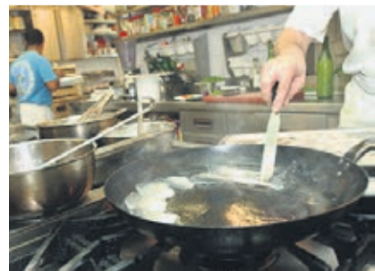
Les secteurs à bas salaires, comme l'hôtellerie-restauration, seront fortement concernés par la motion Ettlín.

La motion Ettlín - du nom de son promoteur Erich Ettlín (Centre) - continue d'agiter le paysage politique suisse. Après avoir été adoptée par le Conseil national, la proposition de l'élu obwaldien a également été acceptée par le Conseil des Etats ce mardi