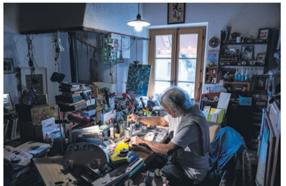
En hiver, chassé de son atelier par le froid, l'artisan préfère peindre.