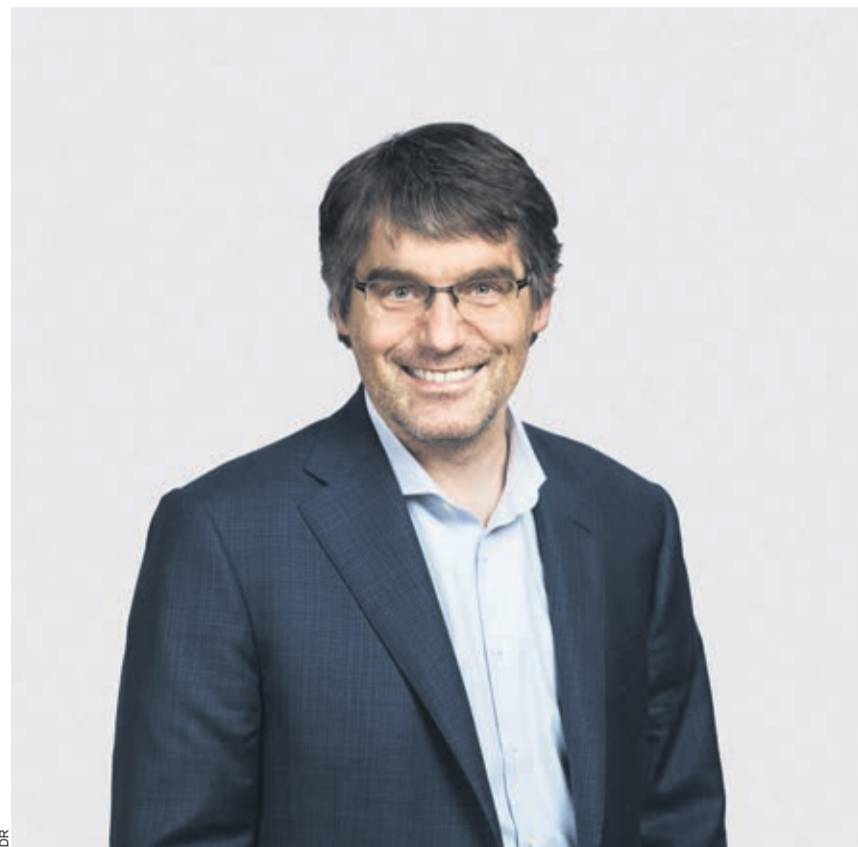
Roger Nordmann estime qu'en baissant l'impôt sur la fortune, on agrandirait le trou financier provoqué par les cadeaux fiscaux faits par le passé aux riches.

Elle ferait tomber les accords bilatéraux avec l'Union européenne et, par conséquent, les mesures d'accompagnement qui protègent les salaires. On risque ainsi de se retrouver dans une situation comparable à celle que connaît le Royaume-Uni après avoir voté le Brexit: une crise économique, une immigration toujours présente, mais beaucoup plus désordonnée, et une dégradation massive des conditions de travail. Il est évident que, dans certains secteurs, notamment celui des soins, nous manquerions dramatiquement de personnel. Or, la population âgée va doubler dans les vingt-cinq prochaines années et nous avons besoin de ces travailleuses et de ces travailleurs. C'est une initiative nationaliste et isolationniste qui se cache derrière un argument pseudo-écologiste, celui de la durabilité,