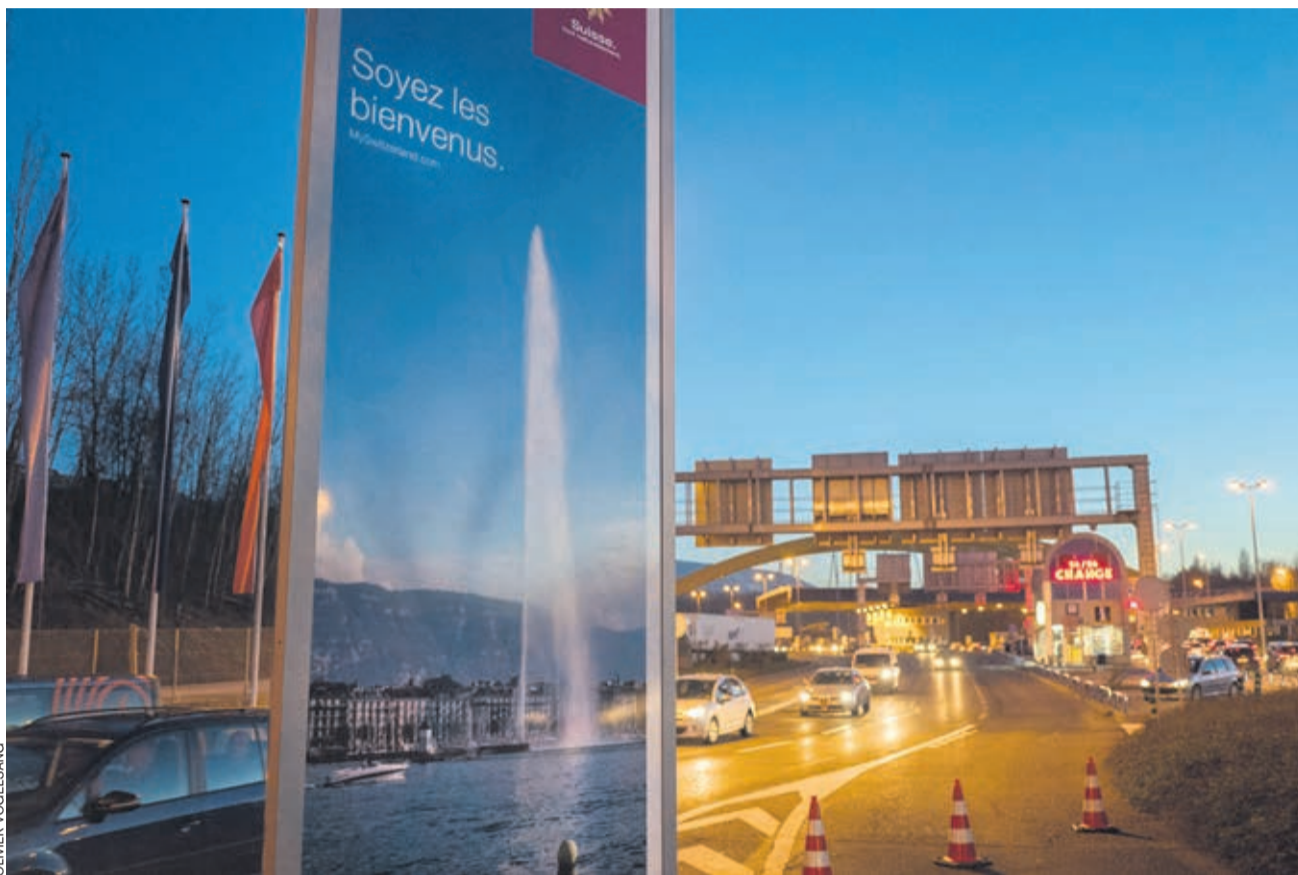
L'initiative, qui refuse que la population de la Suisse dépasse les 10 millions d'ici à 2050, remettrait totalement en cause la voie bilatérale, avec les conséquences désastreuses que cela implique.

Pour le Conseil fédéral, l'UDC fait des promesses en l'air. «Cette initiative ne rendra aucun appartement moins cher et ne libérera aucune place dans le train. Elle ne résoudra aucun problème, au contraire, elle en créera de nouveaux.»