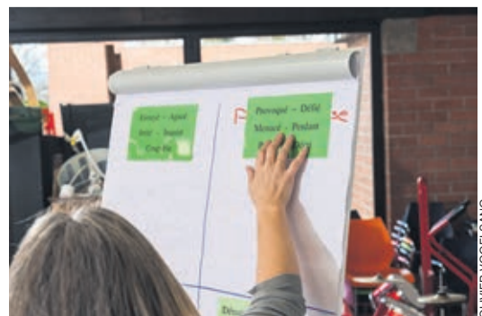
Le corps enseignant est encore très peu racisé, ce qui peut influencer les regards portés sur ces enjeux.