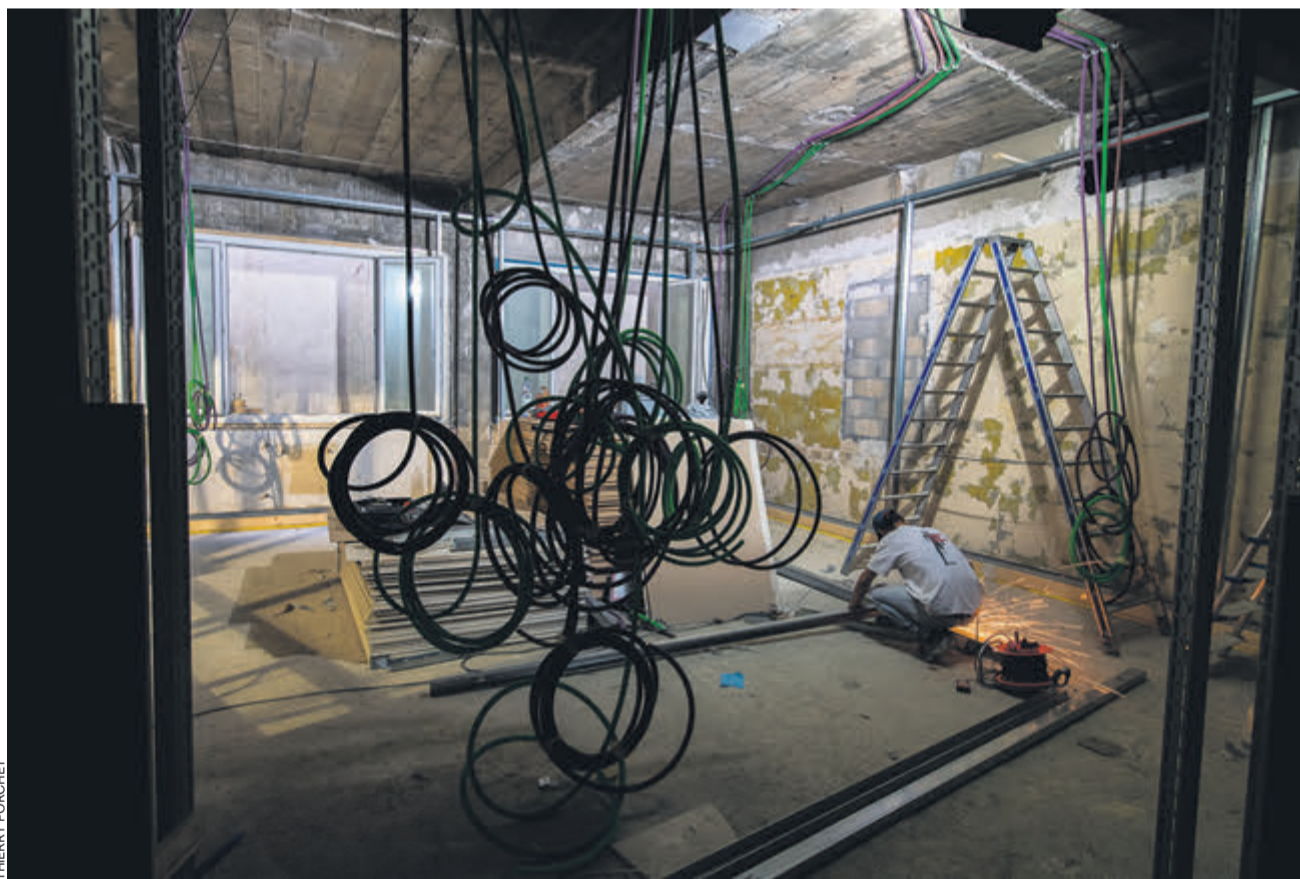
La Maison du Peuple est rénovée par étapes depuis 2017. Toute la partie basse de l'immeuble a été réaménagée, et d'autres chantiers auront lieu d'ici à 2030.