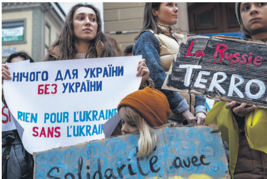
Plus de 500 personnes, majoritairement réfugiées et féminines, étaient présentes à la manifestation.

Le 24 février dernier marquait les trois ans de guerre d'agression de la Russie contre l'Ukraine. Des rassemblements ont eu lieu un peu partout en Suisse et dans le monde. Récit à Lausanne.