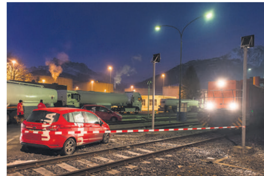
Aigle, blocage de l'entreprise Tamoil, 2015.