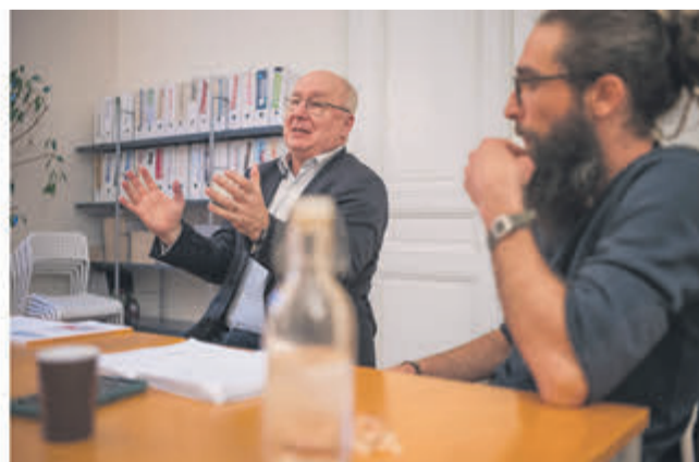
Le 27 février, Pierre-Yves Maillard, président de l'Union syndicale suisse, a été invité pour discuter des questions de l'AVS et des assurances sociales dont s'inspire le réseau pour une Assurance sociale alimentaire.