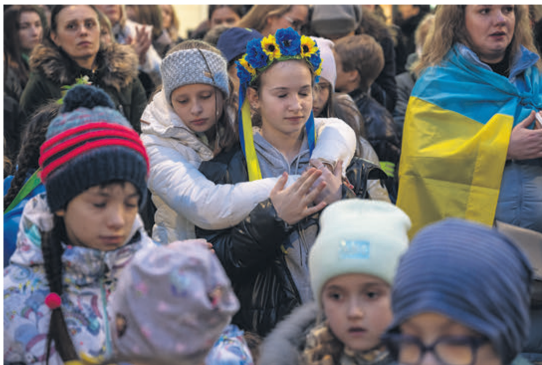
Une rencontre pleine d'émotion...