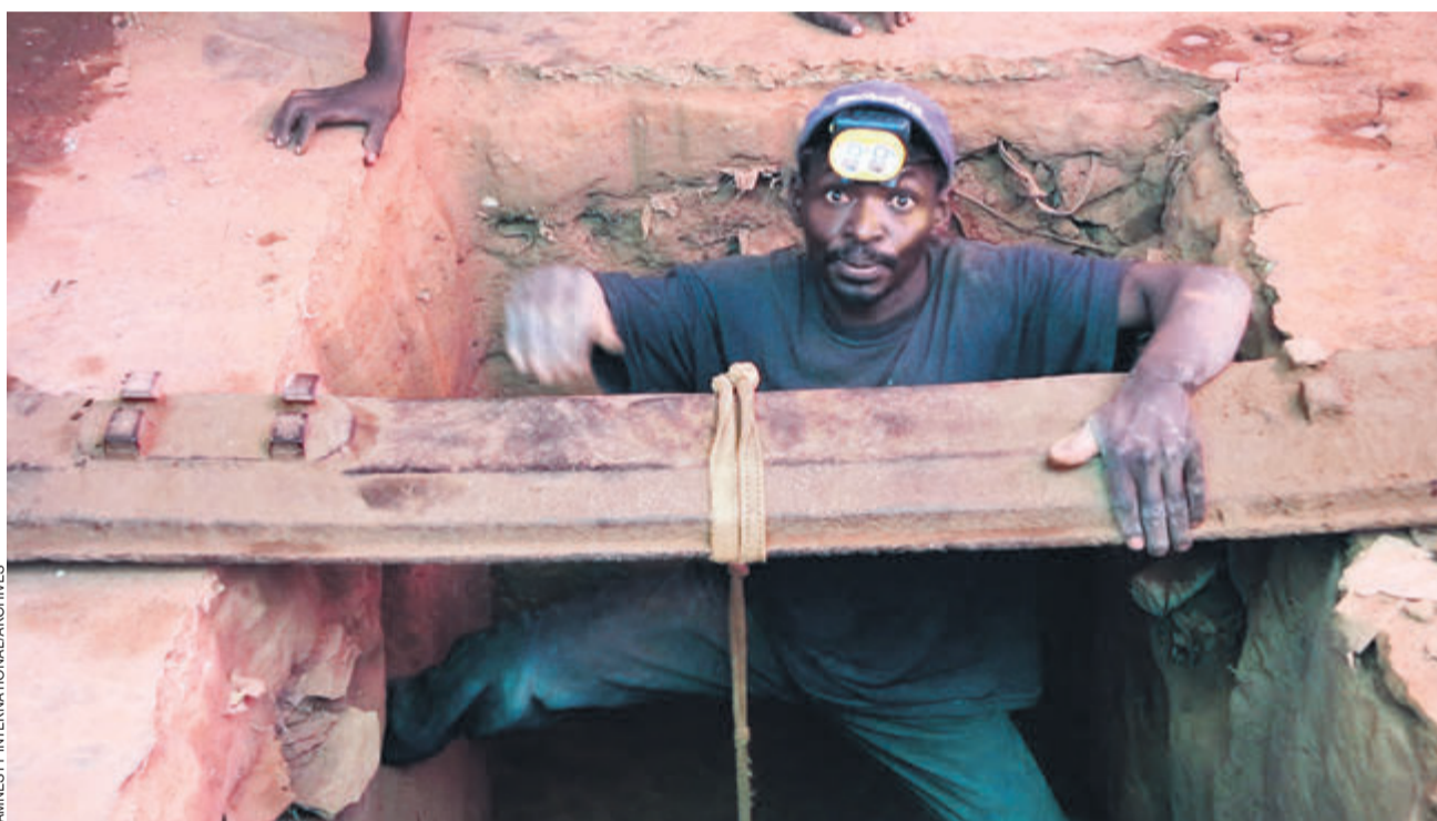
Les conditions de travail dans les mines reflètent la malédiction des matières premières, aux origines d'une guerre sanglante depuis 30 ans.