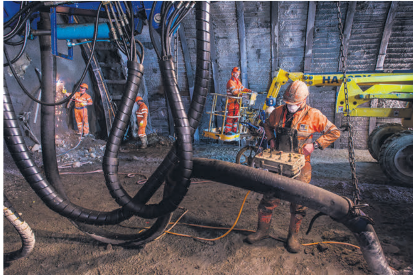
Genève, tunnel du Ceva, 2014.

Dans le cadre du vingtième anniversaire d'Unia, le photographe Thierry Porchet, employé de la première heure, livre une série d'images ayant jalonné la vie du syndicat. Sélection subjective.