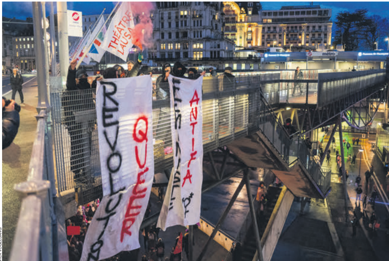
Unia entend intégrer dans ses rangs toutes les personnes actives, indépendamment du genre auquel elles s'identifient.

Il était très important de laisser la parole et l'espace aux personnes concernées par cette thématique, sur les réalités qu'elles vivent au quotidien, sur leur lieu de travail, tout comme dans la vie en général. Au-delà de ce vrai moment de partage, le but était d'abord de créer du lien et un réseau, mais aussi d'avoir des discussions de politique syndicale et de perspectives, dans les