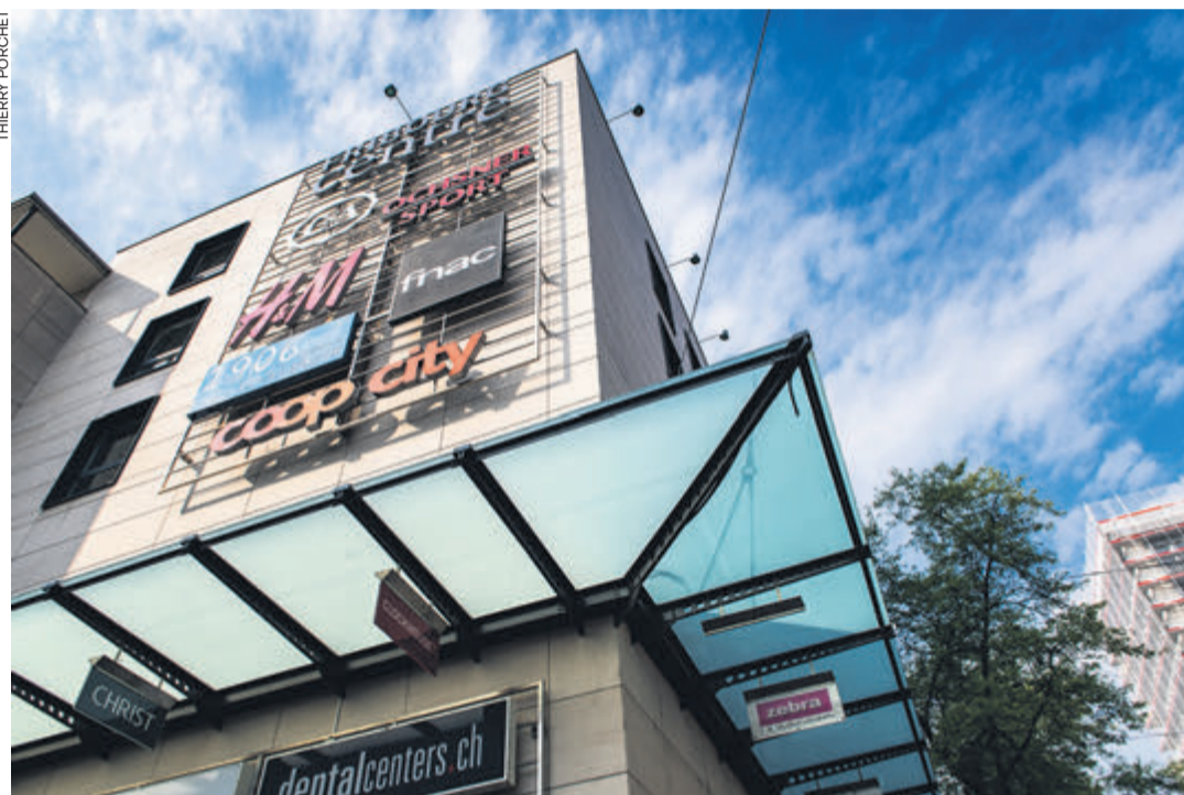
Des discussions avec Trade Fribourg, l'association fribourgeoise des grandes entreprises du secteur de la vente, ont été reprises en vue de l'élaboration d'une CCT.