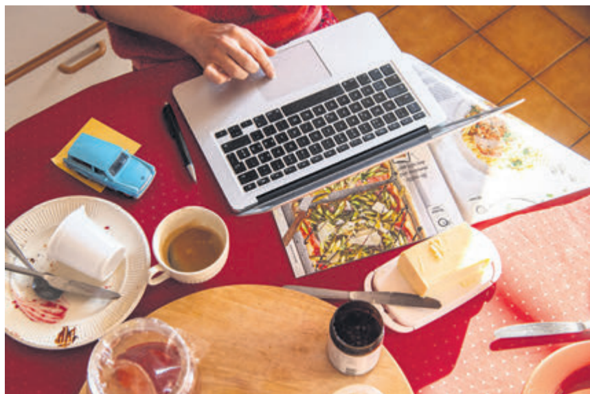
Il est nécessaire d'encadrer le télétravail, qui rend plus floue la frontière entre vie privée et vie professionnelle. Unia ne veut pas d'une flexibilisation à outrance.

Le projet a été transmis au Conseil fédéral pour avis. Il sera probablement soumis lors de la session d'automne au Conseil national. Unia, qui redoute des conséquences «dramatiques» pour la santé des travailleuses et des travailleurs, espère que ce dernier corrigera le tir. ■