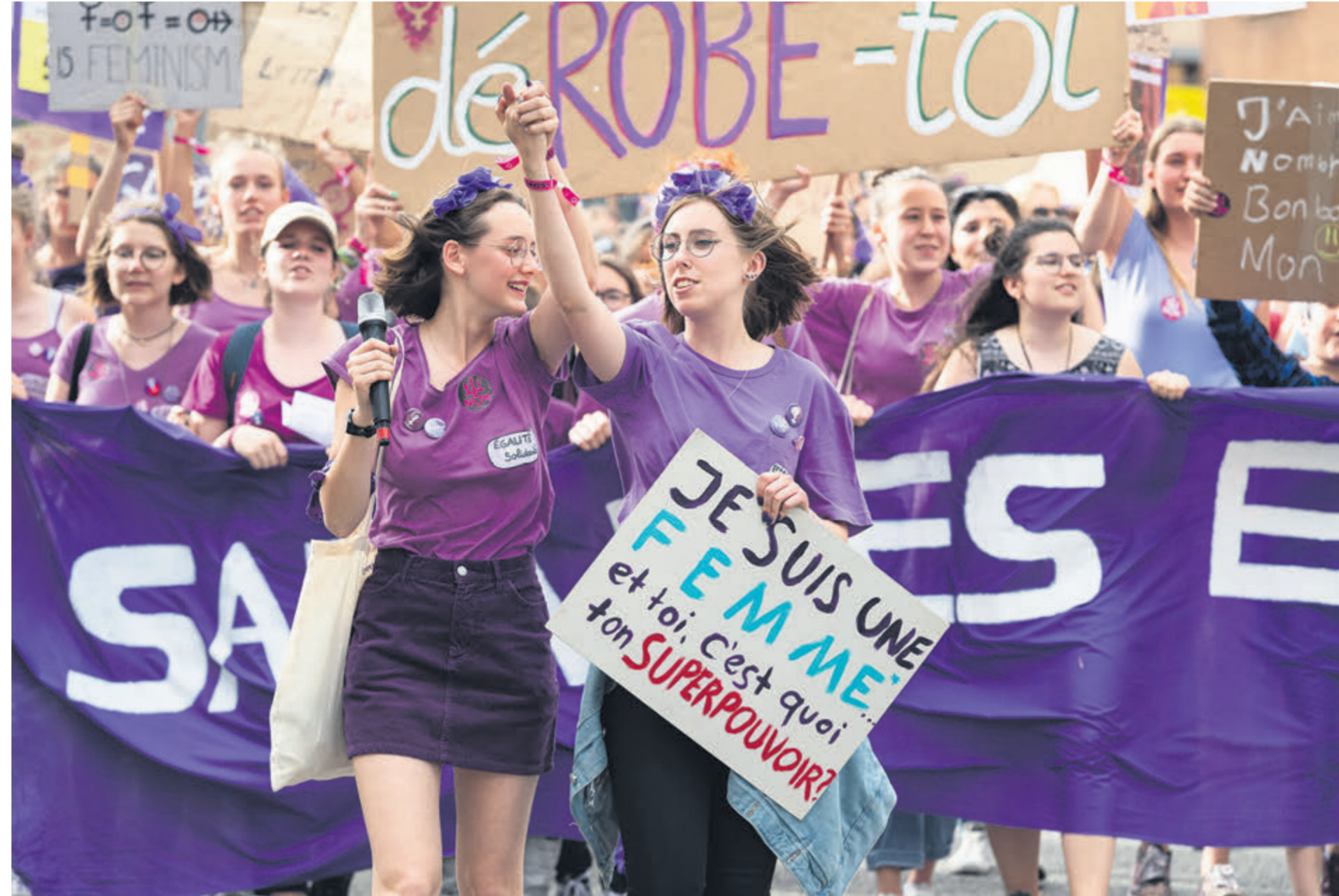
Sion, grève féministe, 2019.