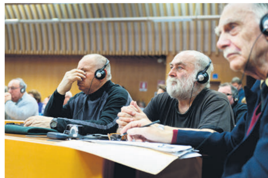
Turin, procès Eternit, 2012.