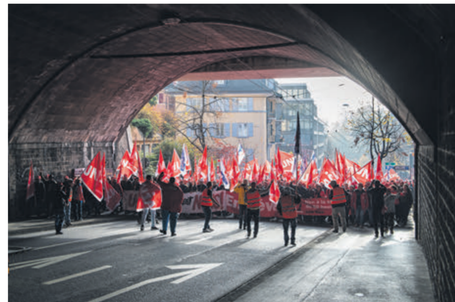
Lausanne, grève des maçons, 2018.