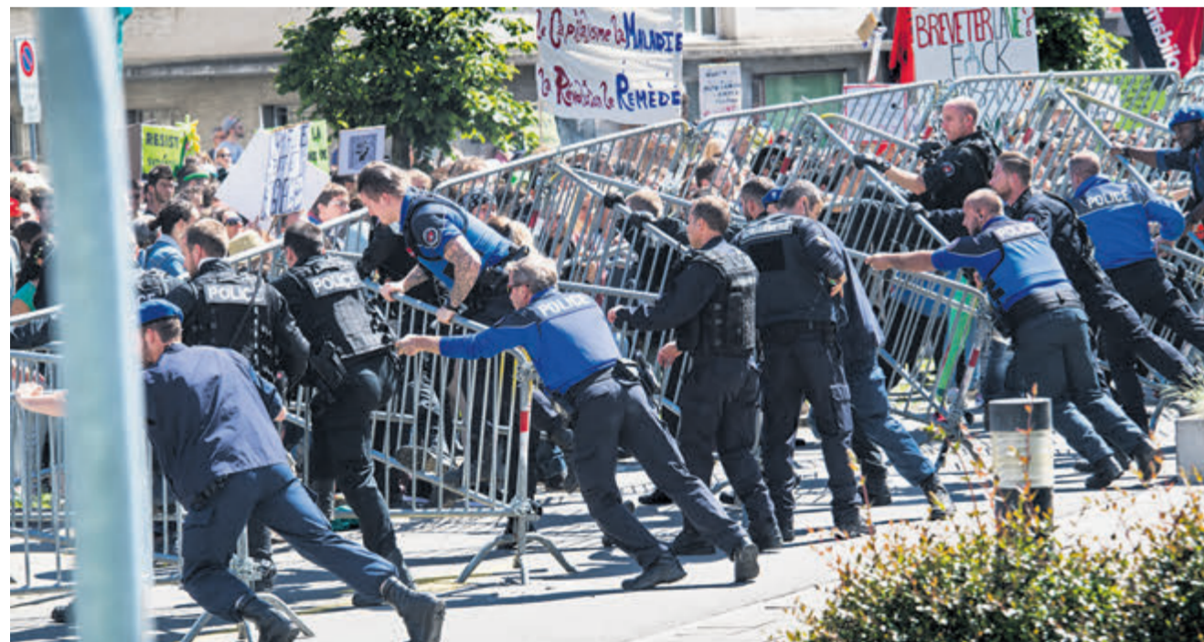
Morges, manifestation contre Monsanto, 2017.