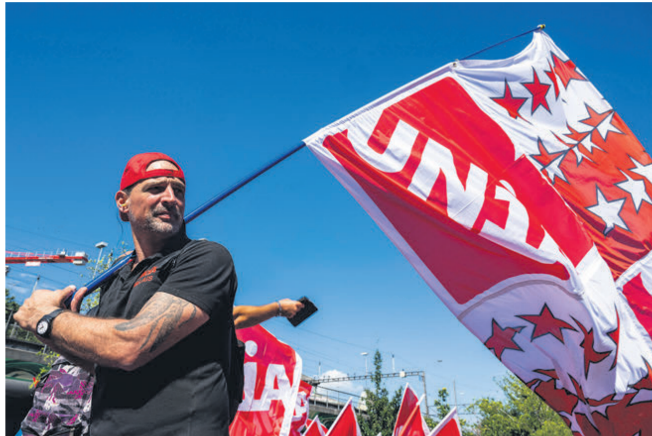
Berne, manifestation contre la vie chère, 2023.