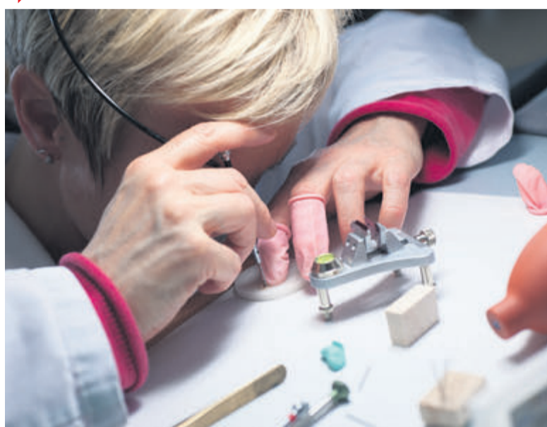
Échec de la conciliation avec l'entreprise Singer SA. Les employés devront continuer à timbrer quand ils vont aux toilettes.