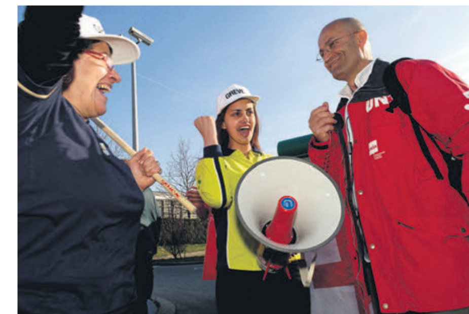
Genève, blocage d'une station BP, 2008.