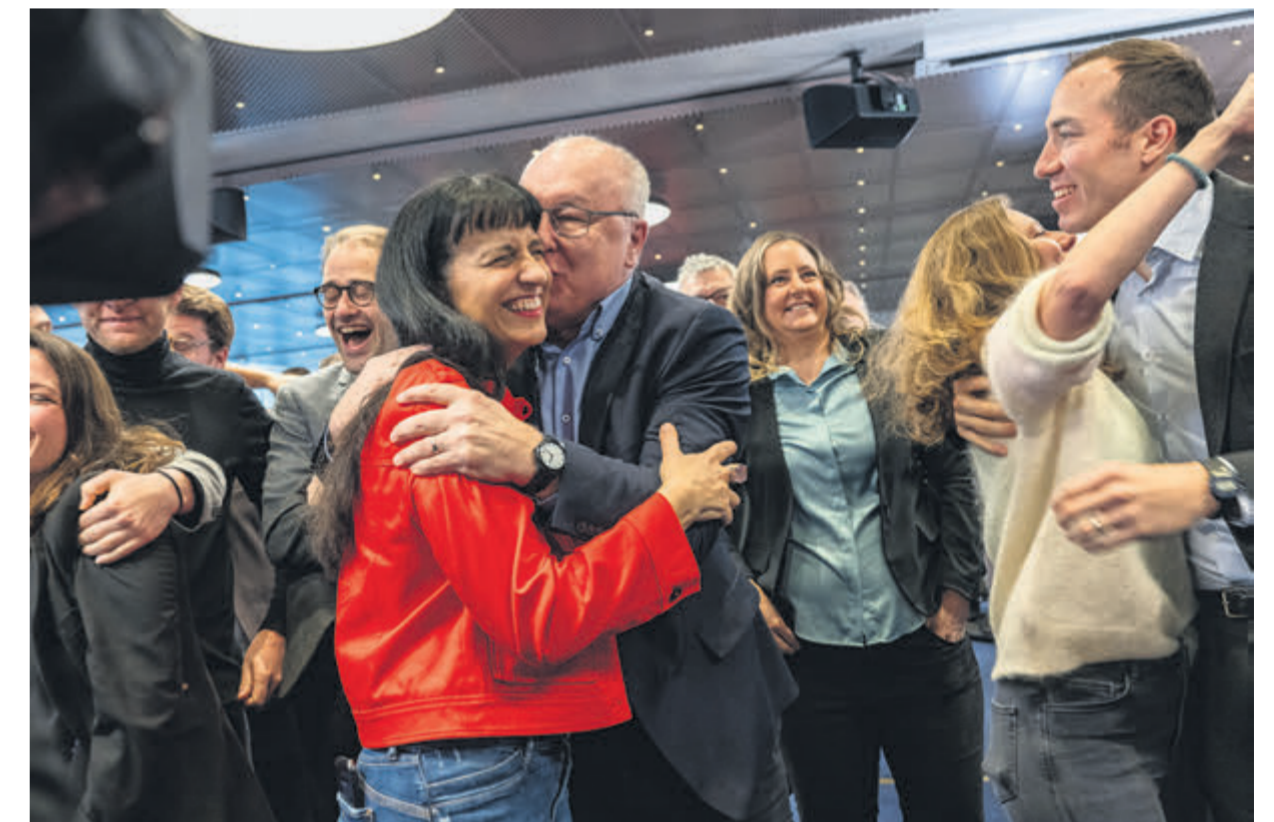
Berne, victoire en faveur d'une 13 e rente AVS, 2024.