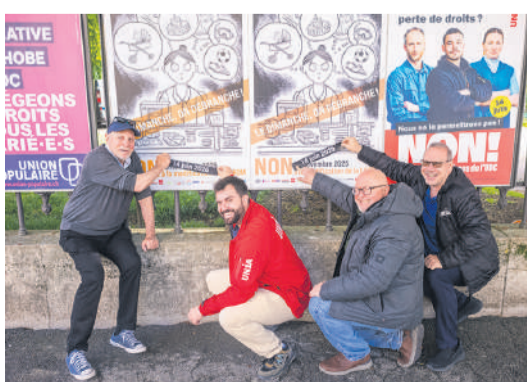
Le 20 mai, des membres du comité référendaire ont mené une action symbolique de correction d'affiches encore datées du 30 novembre 2025.

Le comité est clair: la campagne va encore monter en intensité ces prochaines semaines. Il appelle la population genevoise à refuser cette révision le 14 juin, estimant qu'elle ouvre «une brèche antisociale» dans les protections du personnel du commerce. Et les militants l'assurent, «même en cas de oui, on ne baissera pas les bras!» ■