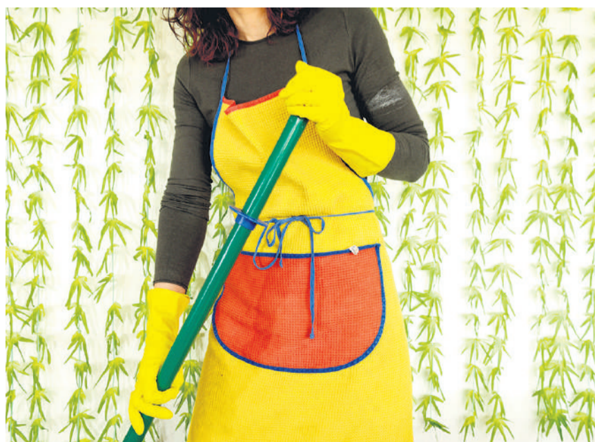
Dans le nettoyage, les salaires et les taux d'occupation restent particulièrement bas.

en partie du résultat de la votation cantonale sur le salaire minimum, qui a lieu le jour même et sera donc suivie