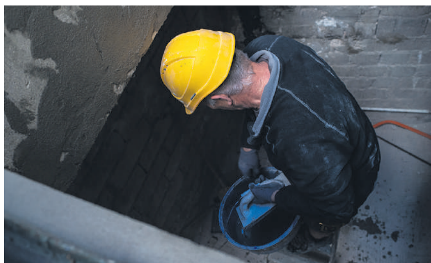
Le Conseil fédéral veut inciter les gens à travailler après l'âge de la retraite.

Le Conseil fédéral propose que les indemnités en cas de maladie ou