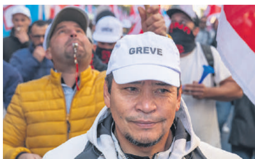
L'USS appelle les autorités suisses et le Tribunal fédéral à adapter leurs pratiques afin de se conformer aux obligations internationales de la Suisse.

Dans un avis consultatif rendu le 22 mai, la Cour internationale de justice (CIJ) confirme que le droit de grève fait partie intégrante de la liberté syndicale protégée par la Convention n° 87 de l'Organisation internationale du travail (OIT). La CIJ rejette ainsi la position défendue depuis plusieurs années par certaines organisations patronales internationales visant à exclure le droit de grève du champ de protection de