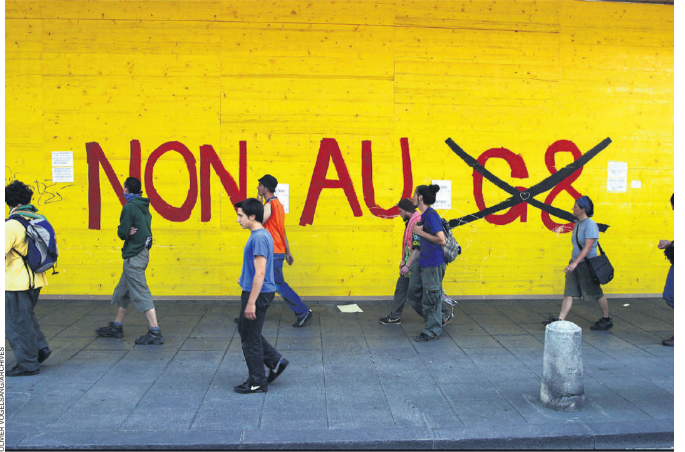
En 2003, le G8 avait déjà tenu son sommet à Evian, ce qui avait impacté Genève.

«La prédation par les pays du G7 - mais aussi par la Suisse - s'effectue également par l'intermédiaire de leurs multinationales à travers une course aux matières premières qui s'épuisent. Cet extractivisme forcé exploite les corps des peuples du Sud global. En même temps, l'Occident ferme ses frontières aux populations des pays qu'il ravage», peut-on encore lire dans l'Appel. De plus, ce système génère l'extinction massive des espèces et une pollution mortifère, rappelle la coalition. Mentionnant la lutte des peuples palestiniens, soudanais, ukrainien ou encore congolais, elle s'insurge contre le cynisme des guerres qui représentent «autant d'opportunités de profits pour les industriels de l'armement». Sans compter que l'argent public détourné au profit de la défense, entraîne toujours plus d'austérité.