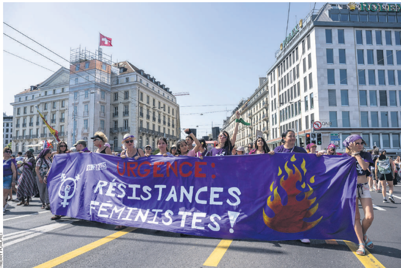
Chaque année, des vagues violettes déferlent dans les villes suisses, pour exiger enfin l'égalité. Ici, à Genève, le 14 juin 2025.

En Suisse romande, la mobilisation prendra cette année une forme particulière. Les organisations appellent les militantes et les militants à converger vers Genève pour participer à la manifestation contre le G7, dont le sommet se tient, pour rappel, à Evian du 15 au 17 juin. «Ce sera donc une année un peu spéciale avec une mobilisation qui sera concentrée au bout du lac, mais des actions auront quand même lieu le 13 juin, comme une grande manifestation à Lausanne», précise-t-elle (voir notre programme ci-contre). A ce sujet, le Collectif vaudois de la grève féministe entend donner une