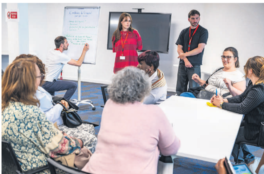
Par petits groupes, les participantes ont réfléchi à des solutions concrètes pour faire face aux problèmes qu'elles rencontrent sur leur lieu de travail.