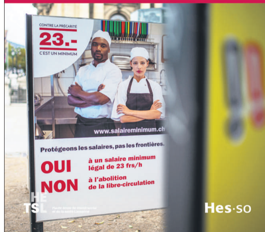
«Le prix de la dignité. Les politiques du salaire minimum en Suisse», Cahiers de l'HETSL, 2026, 312 pages, 35 francs.