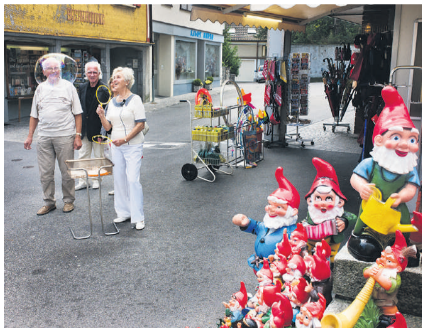
Les seniors représentent 20% de la population neuchâteloise.

« L' Etat et les communes veillent à favoriser la participation, l'autonomie, la qualité de vie et le respect de la personnalité des aînés et des aînées.» Tel est le message du décret du Comité en faveur d'une Constitution cantonale respectueuse des aînés, qui veut inscrire dans la Constitution de la République et Canton de Neuchâtel la notion de reconnaissance des seniors. Le 17 février dernier, le Grand Conseil l'a approuvé par 58 voix contre 38, et 4 abstentions. Le Conseil d'Etat appelle également à voter oui. Pour lui, cette modification s'inscrit dans une vision de solidarité intergénérationnelle, en veillant à l'intégration des anciens dans la société et en valorisant leurs compétences et leur apport à la collectivité. Ce projet s'inspire des constitutions genevoise (article 208) et fribourgeoise (article 35). Il a été lancé par une coalition regroupant la Fédération neuchâteloise