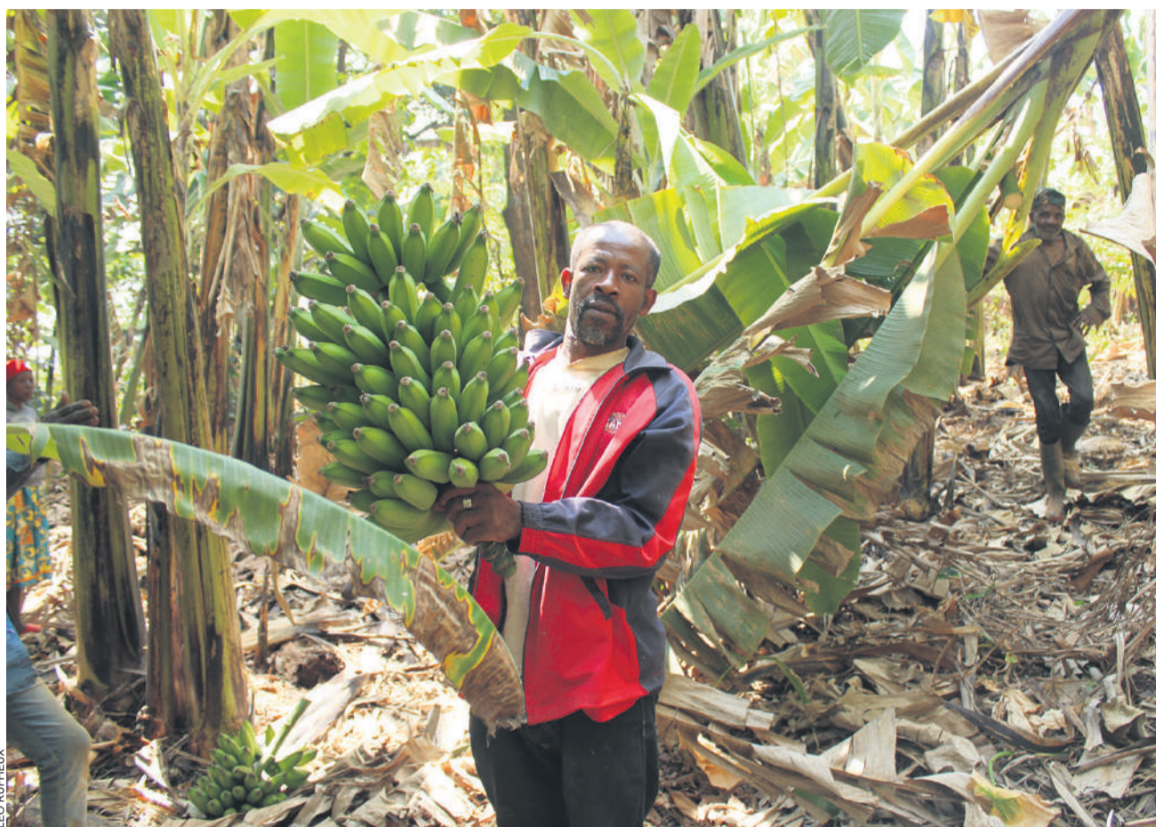
La fondation TerrEspoir travaille avec une coopérative regroupant une centaine d'agriculteurs et agricultrices camerounais, dont elle distribue les fruits en Suisse romande.

Oui. Les modèles de production-consumption à taille humaine, respectueux des droits, des personnes et de l'environnement, représentent une vraie alternative. Les cultivateurs