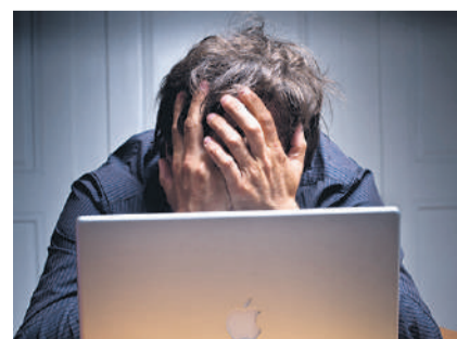
Les travailleurs ont été absents pour cause de santé 8,2 jours en 2025, contre 6,3 jours en 2010. Une hausse inquiétante selon les syndicats suisses.

En 2025, les salariés ont manqué le travail en moyenne 8,2 jours sur l'année en raison d'une maladie ou d'un accident, soit près d'un tiers de plus qu'il y a quinze ans. Ces chiffres sur les absences pour raisons